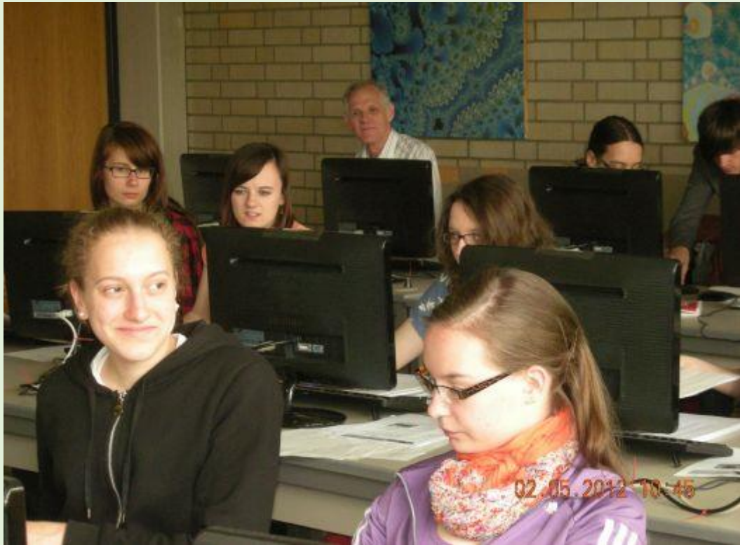
Przygotowujemy prezentacje w sali komputerowej