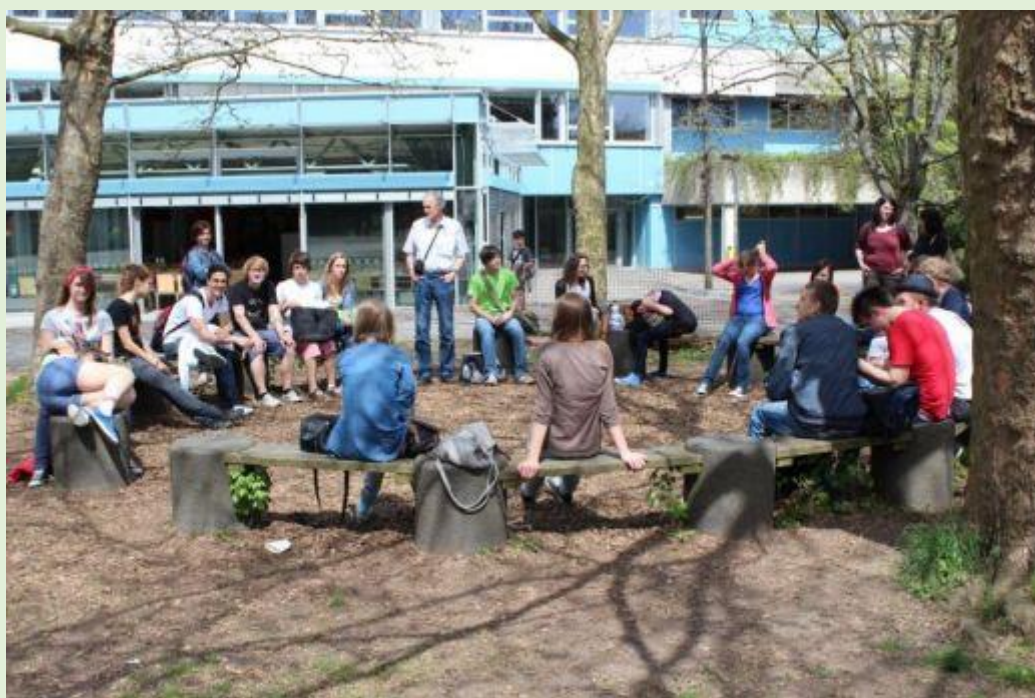
Przed szkołą Stiftsgymnasium