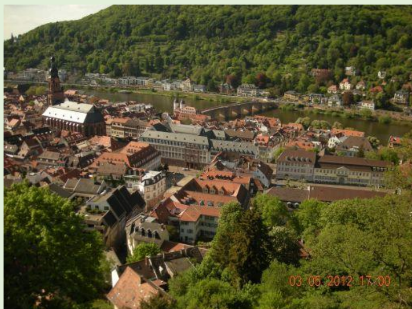
Widok z zamku na Heidelberg