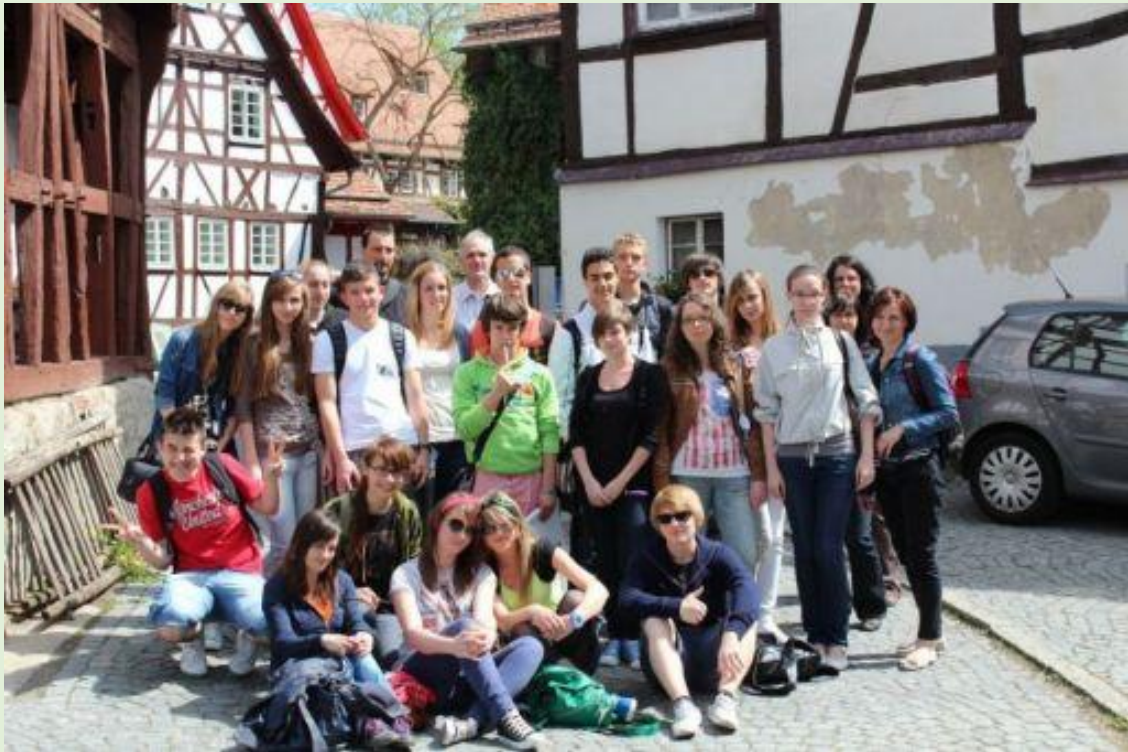
W Starym Mieście w Sindelfingen