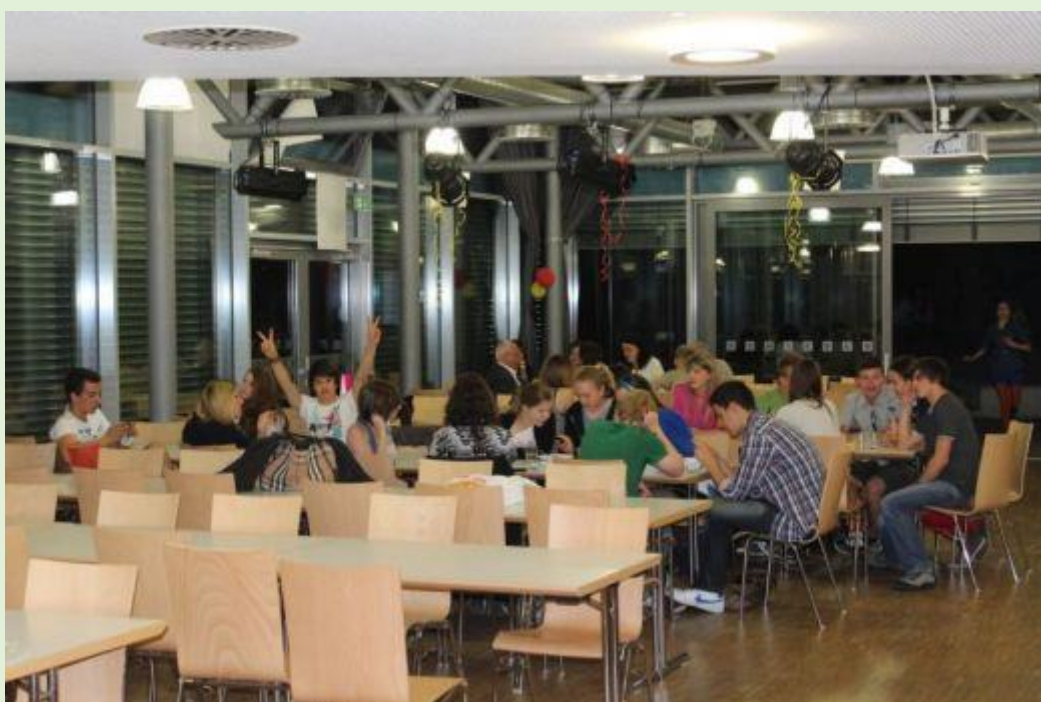
Wieczorek pożegnalny - stołówka szkolna Stiftsgymnasium