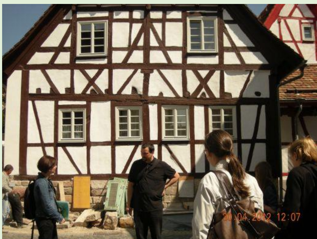
To jest właśnie Fachwerkhaus, dom z muru pruskiego