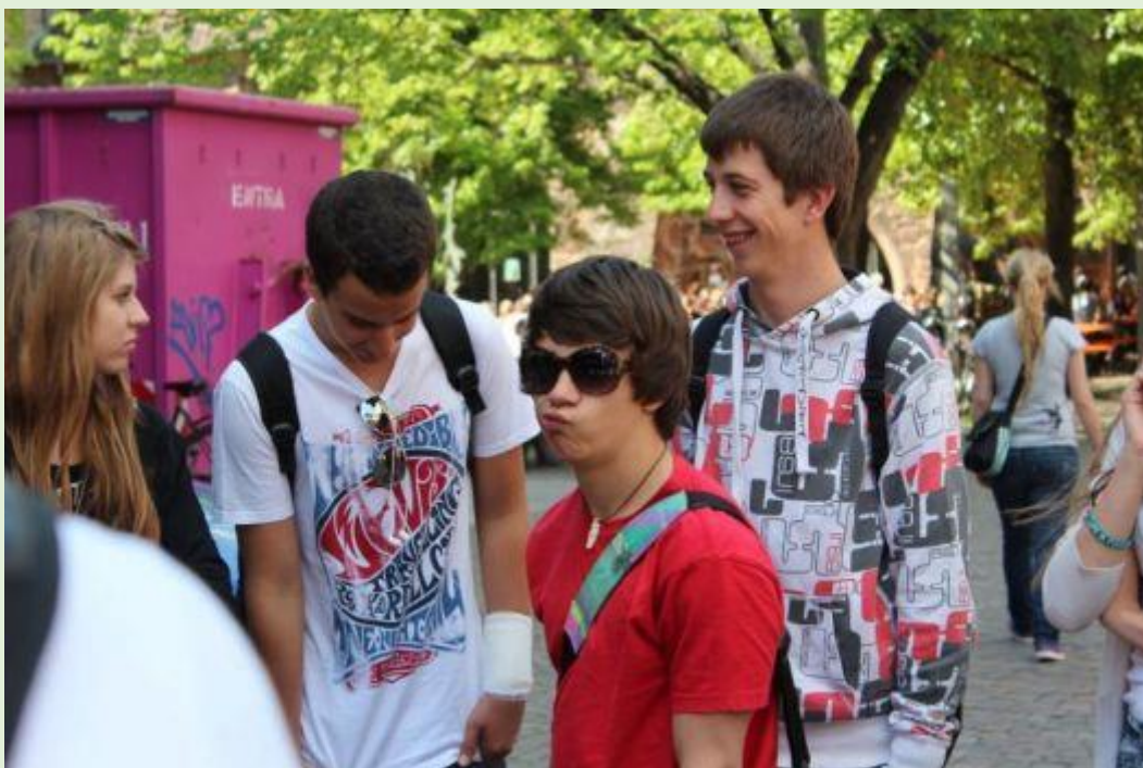
Wycieczka do Heidelbergu