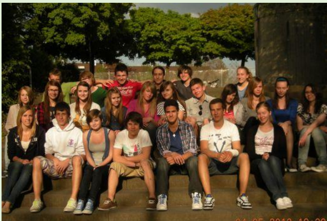
Pamiatkowe zdjęcie przed szkołą Stiftsgymnasium

Podczas gdy większość z nas cieszyła się długim weekendem grupa 11-stu uczniów z naszej szkoły spędziła tegoroczną majówkę niezwykle pracowicie, a mianowicie na wymianie polsko-niemieckiej w szkole partnerskiej Stiftsgymnasium w Sindelfingen. Ich osobistym celem było podszlifowanie języka niemieckiego oraz dogłębne poznanie kultury niemieckiej.